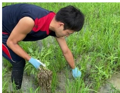
ミズキンバイの除草