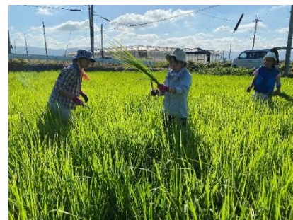
大きくなると大変