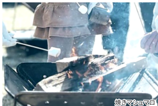
焼きマッシュマロ

市内の子どもが作った木作品や木と暮らすデザイン KYOTOパートナーがデザイン、制作した木製品等の展示などを行います。 ※内容に変更がある場合があります。